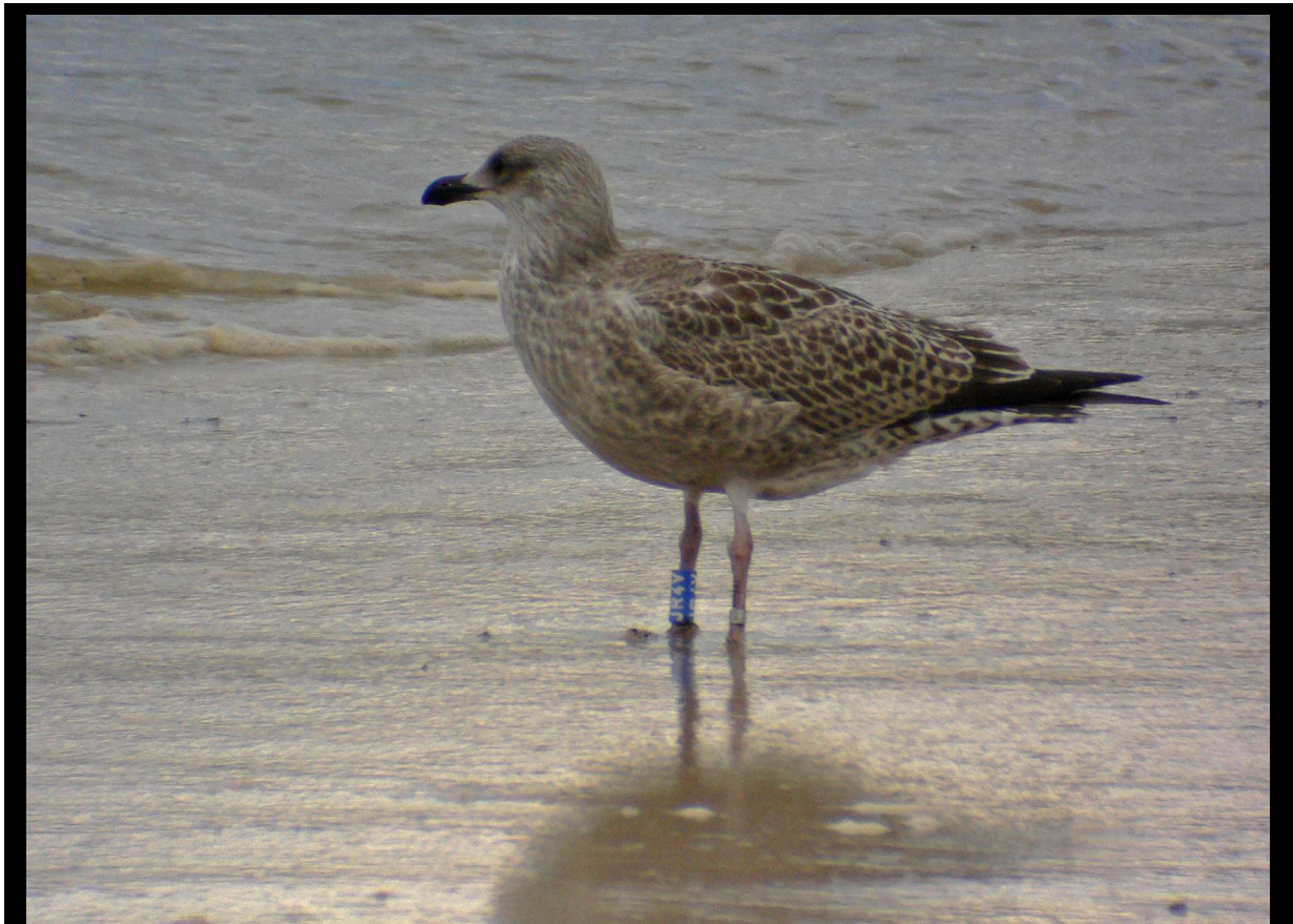
Denne gråmåken ble fargemerket på Jarstein som unge 30/6 2005. Etterpå er den sett flere ganger vinteren gjennom rundt området ved Stavasanden.

* Lokale gjenfunn og egenkontroller er definert som 0-30 km mellom merke- og funnsted. Dersom det er under 3 km mellom merke- og funnsted, må det ha gått minst tre måneder mellom merking og gjenfunn for at det reknes med.