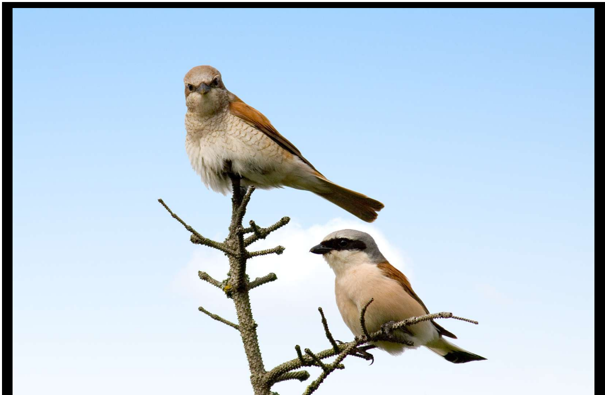
Dette er et av tornskateparene som hekket i Karmøyheiene i 2005.

Nettfangsten på Karmøy fortsatte etter fast mønster på Blikshavn. Utpå høsten ble fangst forsøkt på to nye lokaliteter, Skår og Syre. På sistnevnte sted finnes en takrørsump som gav lovende resultater. Så ulike arter som trekryper, svarstrupe og gulspurv havnet i netta i sivskogen. Mesteparten av voksenfugl-merkingen i Tysvær skjedde på Vårå og Håland. Nettfangsten som ble satt i gang i Beiningen, SØ-Karmøy, i fjor, ble ikke videreført, og merkingen på Matland ble avsluttet. Det ble ikke satset på vadefuglfangst i år, også havsvalene fikk fly forbi i fred.