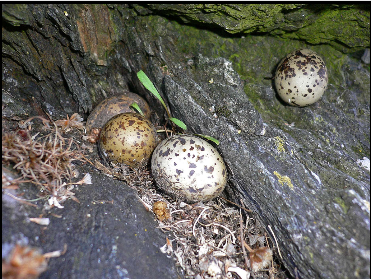
Disse terneungene tok minken seg av før de ble klekket.

I Tysvær hvor det ikke ble drevet minkjakt, ble det et helsvart år for ternene. Til tross for god overvåking av koloniene, ble det ikke påvist en eneste ungfugl på vingene. Særlig trist er minkens årlige herjing med sjøfuglene i den unike skjærgården sør for Kårstø. Nord-Rogalands trolig siste par av tjuvjo fikk eggene tatt både i fjor og i år. Mink ble påvist på fersk gjerning selv på en knøttliten holme så langt ut en kan komme på sjøen i Tysvær. Storskarvkolonien som holdt til der inntil i fjor, hadde flyttet til et skjær i nærheten.