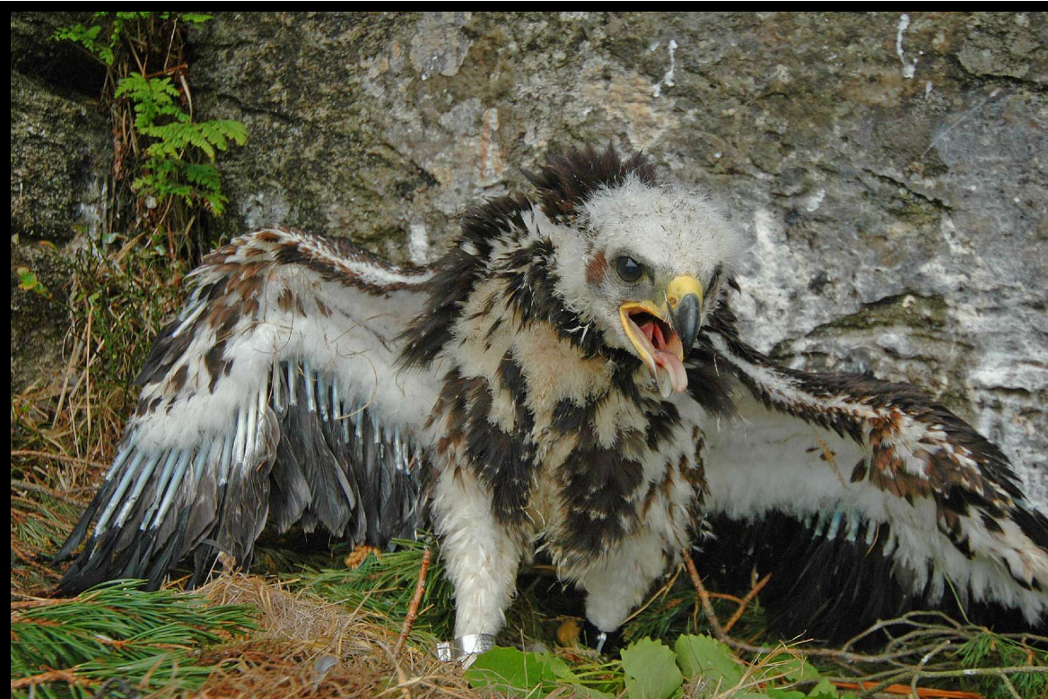
Den ene av de to kongeørnungene som ble merket av Karmøy RG i 2005.

Merking i utvalgte områder av Karmøys lyngheier fortsatte fra tidligere år og resulterte bl.a. i ny årsrekord for tornskate og nest beste år for svartstrupe. 130 løvsanger-unger er det tredje