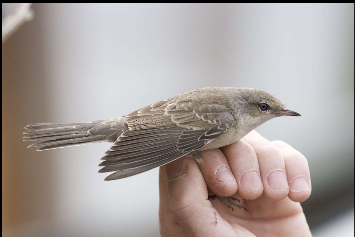
Hauksanger var en av godbitene som havnet i nettene på Syre.

Høstenes nettfangst foregikk fra juli til november, i hovedsak på tre lokaliteter: Blikshavn og Syre i Karmøy og på Håland i Tysvær. Seint i sesongen ble det forsøkt med litt nettfangst på Skår ved Kopervik. Merking på foringsplasser foregikk for det meste i Tysvær.