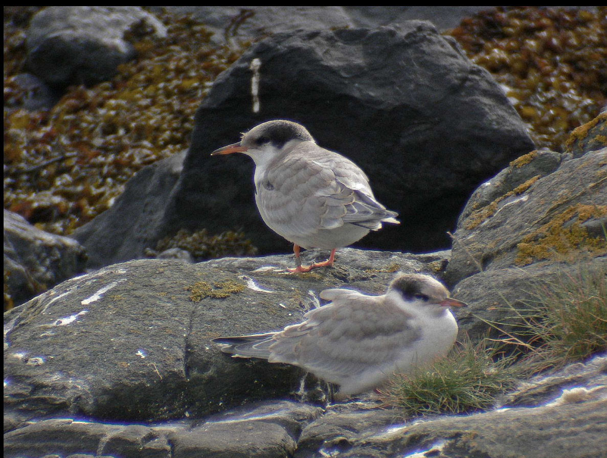
Her er to av makrellterneungene som vokste opp på Karmøy i 2005.

Rapporter om hekkesvikt for sjøfuglene en rekke steder langs kysten i 2004, fikk Karmøy Ringmerkingsgruppe til å planlegge en grundig oppfølging av koloniene i vårt område av Nord-Rogaland i 2005. Vi fikk gjennomført kartlegging og opptelling av ternekoloniene i Karmøy og Tysvær. Uventet mange rødnebbterner gikk til hekking sammen med et mer